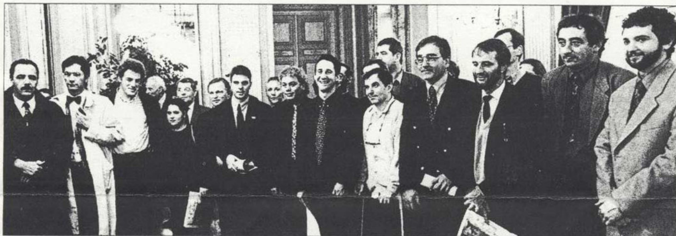
Les lauréats ont reçu leurs trophées dans les salons de la préfecture

La troisième édition du prix OSER en Dordogne, a récompensé dix-sept lauréats qui osent, servent, entreprennent et réussissent